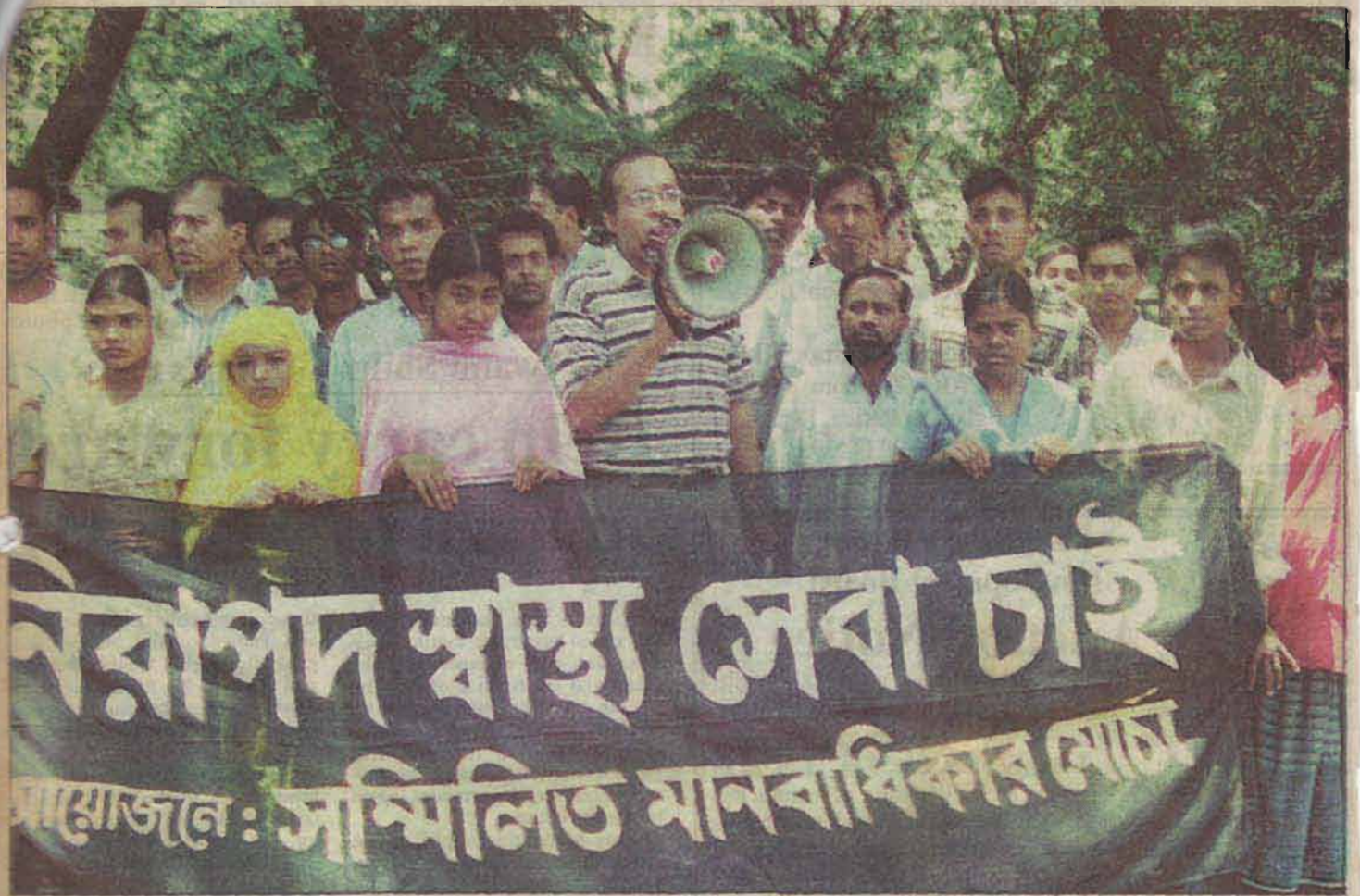
Sammilito Manabadikar Morcha held a rally in front of Jatiya Press Club yesterday demanding safe healthcare and protesting inhuman behaviour to patients in government hospitals.