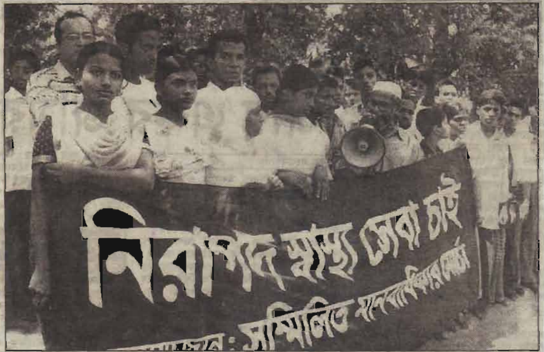
নিরাপদ স্বাস্থ্যসেবার দাবিতে সম্মিলিত মানবাধিকার মার্চ। গতকাল গ্রেস ক্লাবের সামনে অবস্থান কর্মসূচী শালন করে