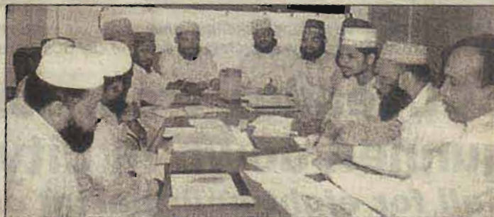
Environmental issues are being discussed at one of the Study Circles of AFEHRD, in the city recently.

In the 5-day study circle discussion about 130 participants are taking part in the effort.