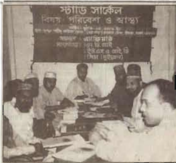
স্ট্যাডি সার্কেল 'পরিবেশ ও স্বাস্থ্য' ইমাম গ্রুপ-আয়োজনে অ্যাফিয়ার্ড

বুধবার ১ শ্রাবণ ১৪১০ বাংলা ১৬ জুলাই ২০০৩ ইং